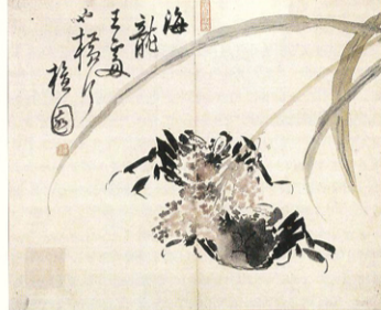
(나) 조선 김홍도, <계>