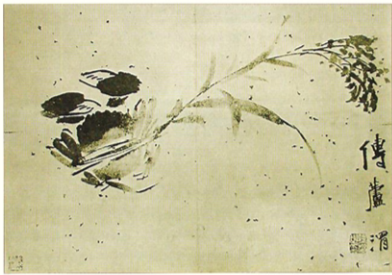
(가) 명대 서위, <전려도>