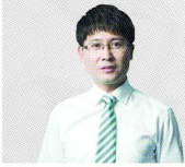
출제 : 조은중 교수 | 박문각남부고시학원