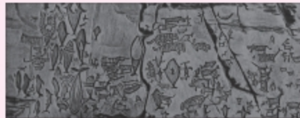
㉤ 반구대 암각화의 모습

대표적인 암각화 유적으로는 울산 울주 대곡리 반구대 암각화, 경북 고령 장거리 암각화 등이 있다. 사슴·멧돼지·고래·동심원 등이 그려진 것을 통해 사냥의 성공과 풍성한 수확 등을 염원 하였음을 알 수 있으며, 또한 울타리 안에 있는 동물의 모습을 통해 목축이 이루어졌음을 알 수 있다. 그리고 사면(제사장)으로 보이는 사람의 존재를 통해 풍요로운 사냥 등을 기원하는 종교 의례가 행하여졌음도 알 수 있다.