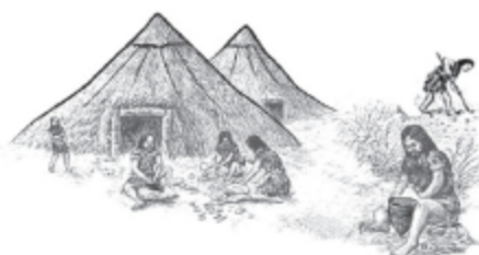
③ 신석기 시대 생활 모습