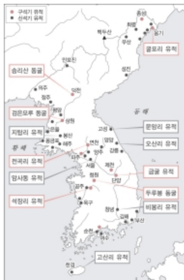
② 구석기·신석기 시대 유적 분포