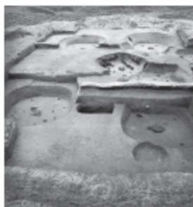
② 암사동 선사 유적지