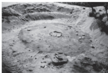
② 양양 오산리 집터 유적